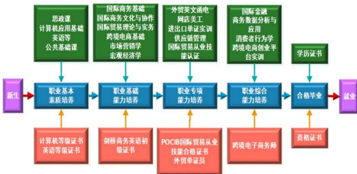
图 2 课程体系与职业能力之间的匹配关系

课程体系的设置服务于专业能力结构的要求，整个课程体系划分为公共课、专业基础课、专业核心课、专业拓展课、毕业实践等五大模块，为学生逐步构建职业基本素质、职业基础能力、职业专项能力和职业综合能力，以适应职业面向与岗位需求。