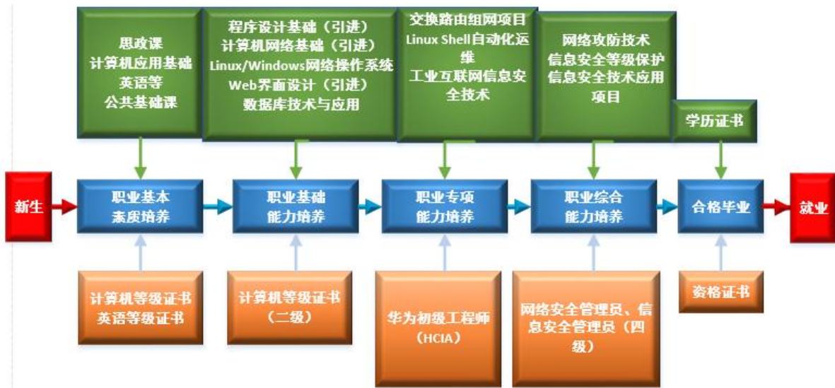
图 2 课程体系与职业能力之间的匹配关系