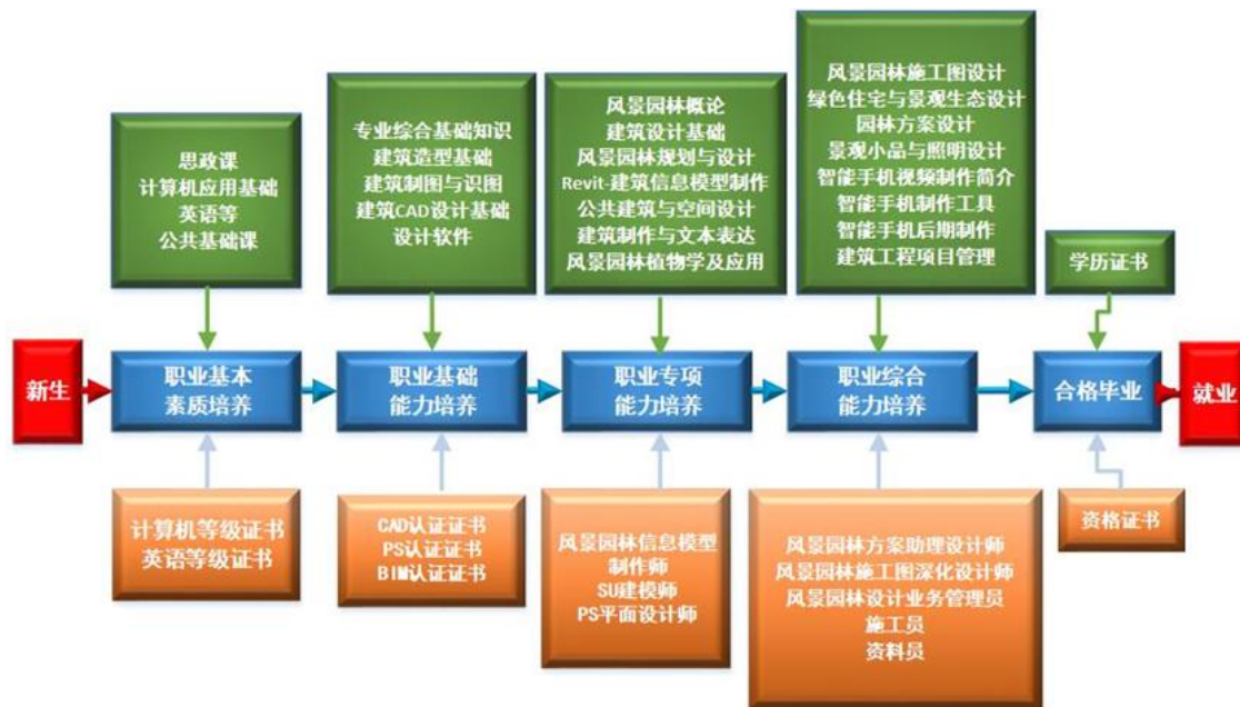
图 2 课程体系与职业能力之间的匹配关系